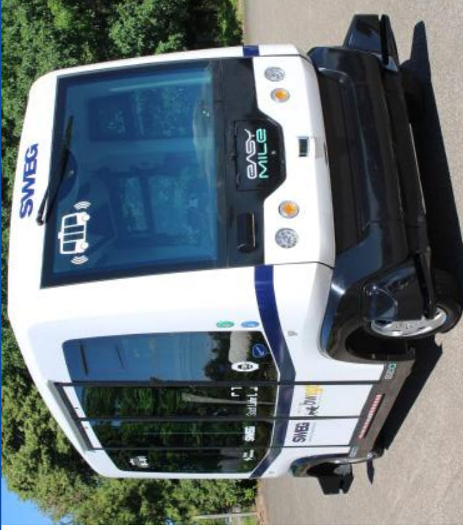
Herausgeber: SWEG Südwestdeutsche Landesverkehrs-AG, Rheinstraße 8, 77933 Lahr, www.sweg.de - Änderungen vorbehalten - Stand: 9. Juli 2018