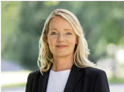
Thekla Walker MdL, Ministerin für Umwelt, Klima und Energiewirtschaft des Landes Baden- Württemberg

Im Sinne des Klimaschutzes muss die Transformation der Automobilwirtschaft ganzheitlich gedacht werden. Insbesondere schwere Nutzfahrzeuge müssen einen stärkeren Beitrag zur Dekarbonisierung des Verkehrssektors leisten. Der Aufbau der dazugehörigen Infrastruktur beinhaltet dabei große Herausforderungen. Es müssen flächendeckend Netzanschlüsse geschaffen und eine bedarfsgerechte Energieversorgung gewährleistet werden. Entsprechende Hemmnisse beim Aufbau von Ladeinfrastruktur für die Elektromobilität müssen abgebaut werden. Hierfür wird der Schwerpunkt Energie auch weiterhin einen wichtigen Beitrag innerhalb des Strategiedialogs Automobilwirtschaft Baden-Württemberg leisten.